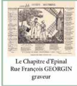
Le Chapitre d'Epinal Rue François GEORGIN graveur