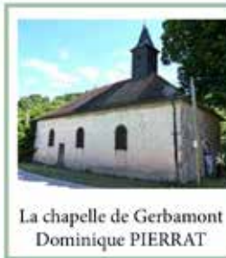
La chapelle de Gerbamont Dominique PIERRAT