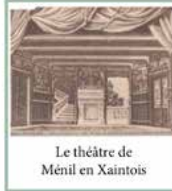
Le théâtre de Ménéville en Xaintois