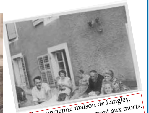
Photo d'une ancienne maison de Langley, située à l'emplacement du Monument aux morts. (près de Mme Honoré).