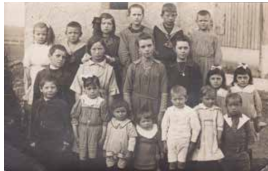
Les enfants de Langley en 19??

Une copie sera réalisée et les originaux vous seront rendus immédiatement.