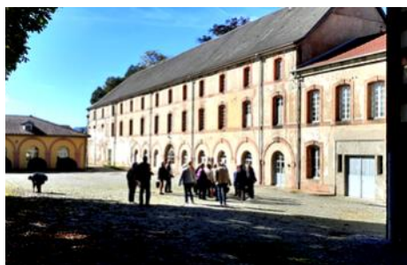
Les bâtiments agricoles