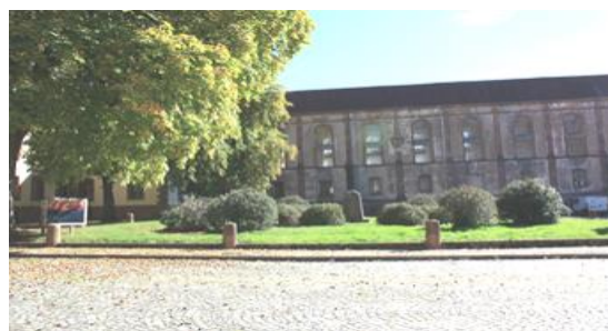
La bibliothèque Dom Calmet