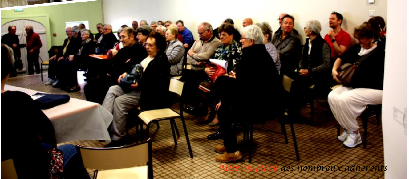
Mise en place des nombreux adhérents