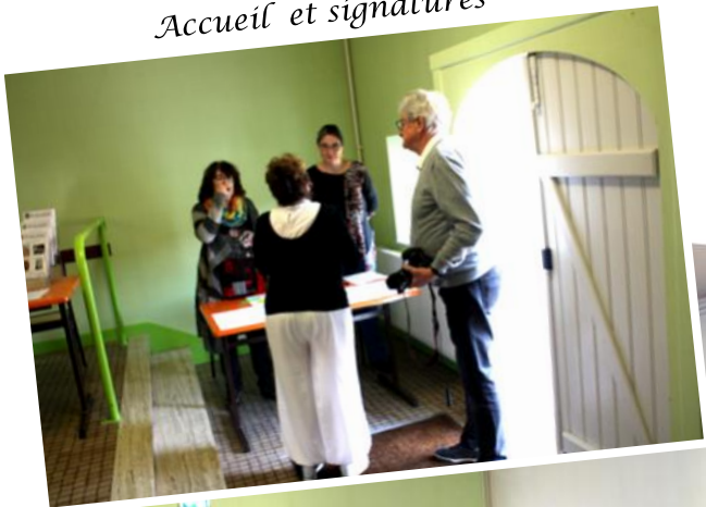
Accueil et signatures